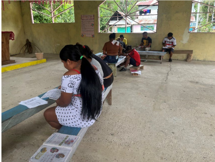
Desarrollo de herramientas Cuadernillo MI RUTA CampeSENA 2025: